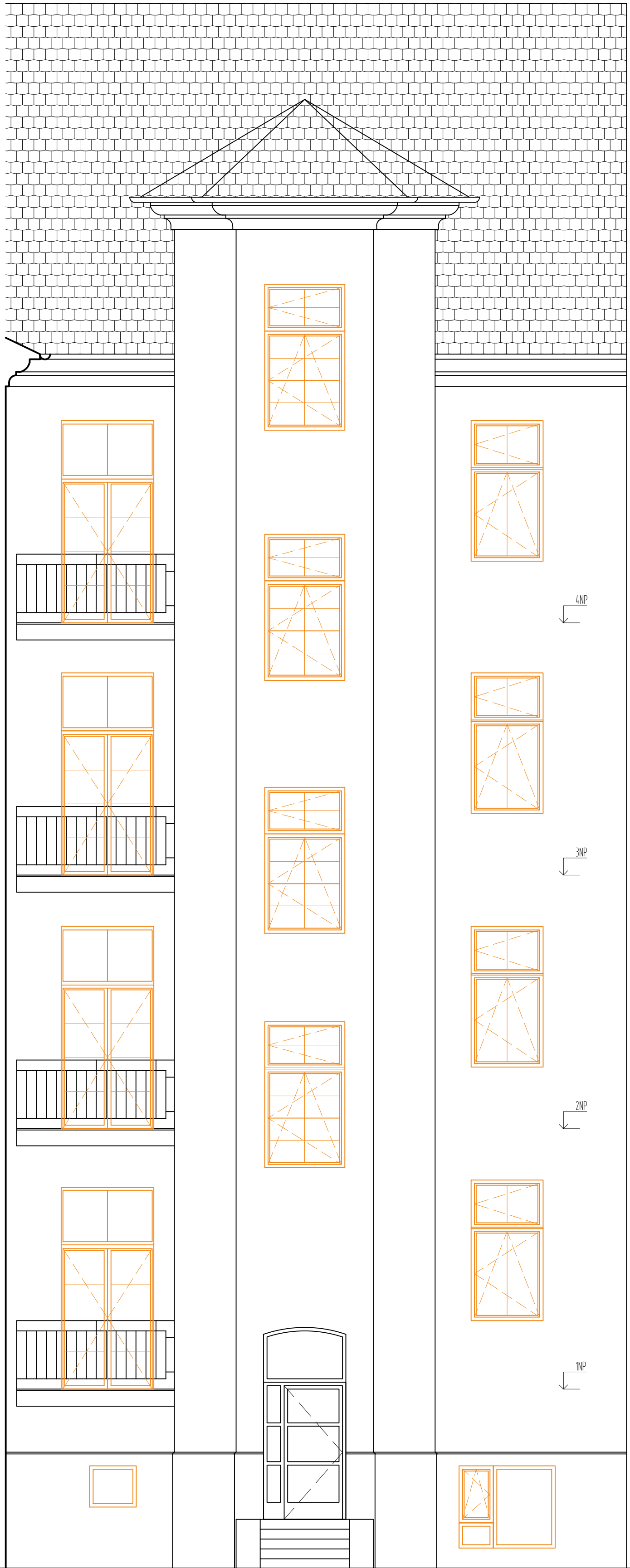
POHLED ZADNÍ 1-1' - PŮVODNÍ STAV