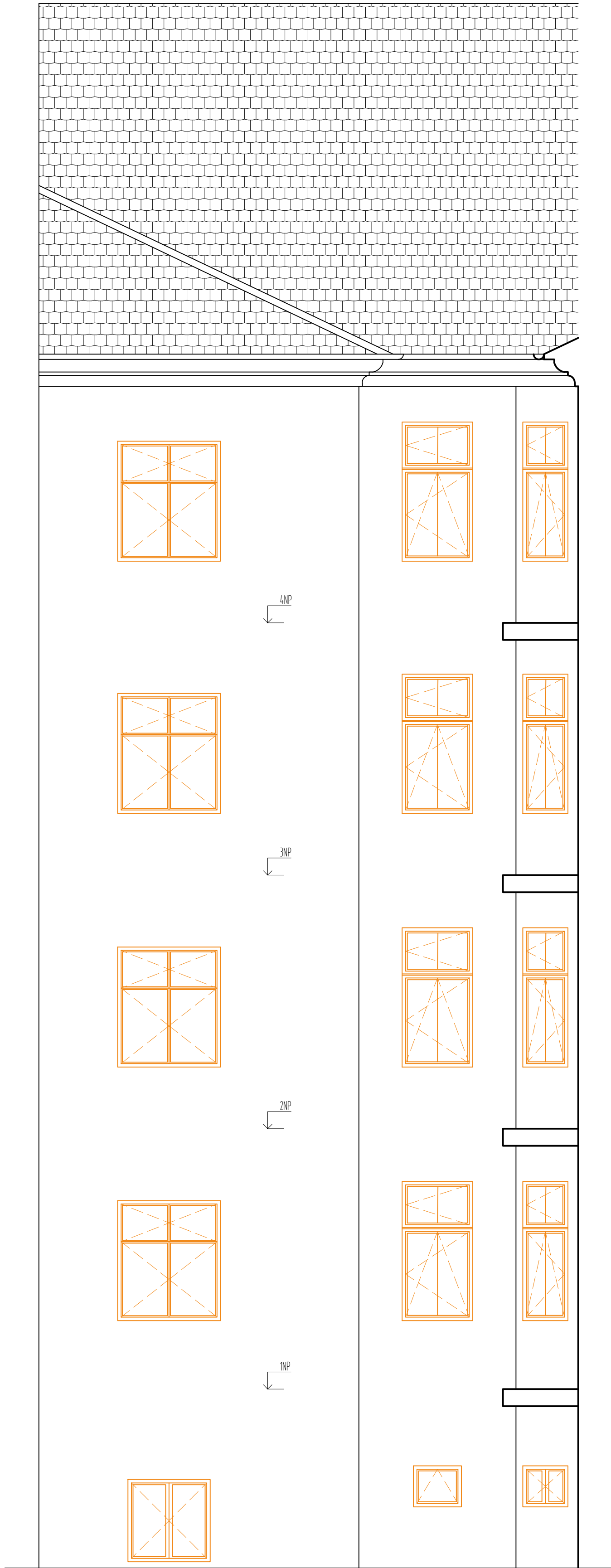
POHLED ZADNÍ 2-2' - PŮVODNÍ STAV